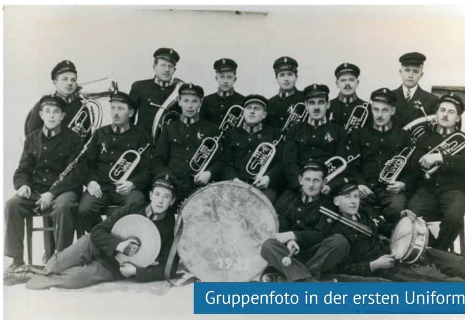
Gruppenfoto in der ersten Uniform

Das Gruppenfoto zeigt die Musikkapelle Arnreit in der ersten Uniform und entstand zwischen 1935 und 1937.