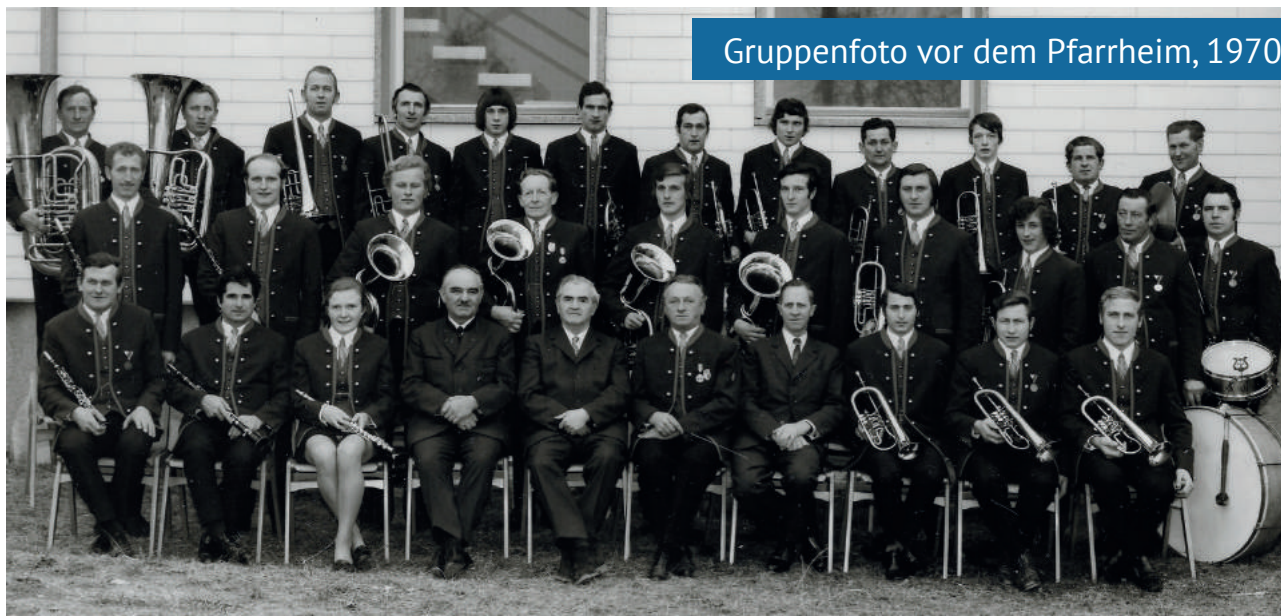
Gruppenfoto vor dem Pfarrheim, 1970