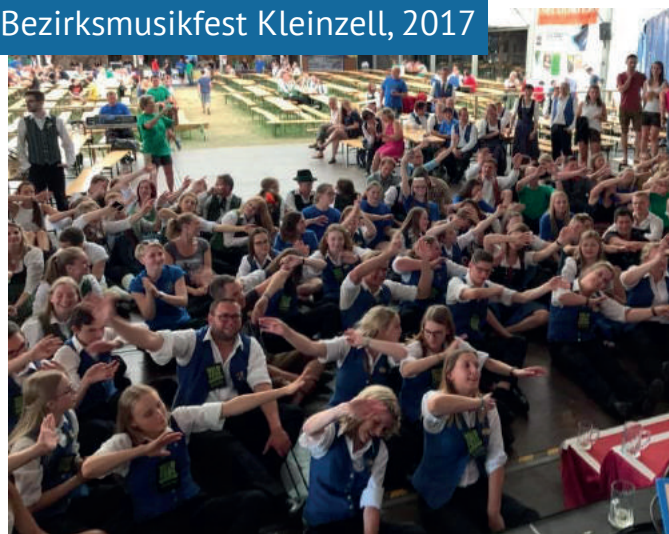
Bezirksmusikfest Kleinzell, 2017