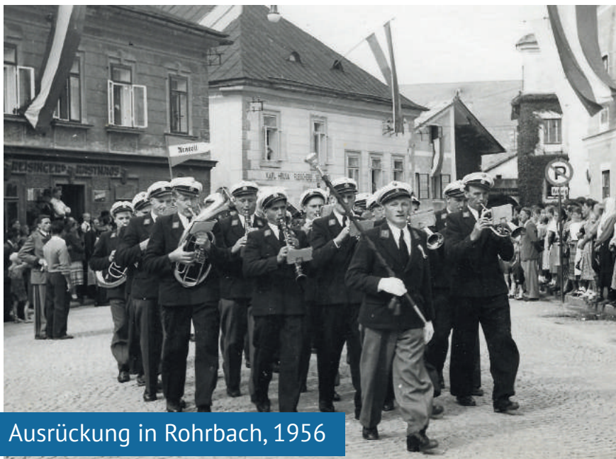
Ausrückung in Rohrbach, 1956

In diesem Jahr schloss sich die Ortsmusikkapelle dem Oberösterreichischen Blasmusikverband offiziell als Verein an.