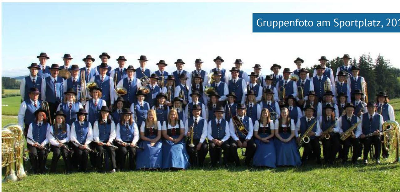
Gruppenfoto am Sportplatz, 2014

Durch die großartige Unterstützung der Bevölkerung gewann der MV Arnreit die erste Staffel der „Radio OÖ Aufweckbläser“. Belohnt wurde der Landessieg mit Auftritten bei „Arcimbolde“ am Südbahnhofmarkt, beim „Radio OÖ Sommer Open Air“ in Bad Schallerbach und mit einem Instrumentengutschein. Hauptpreis war eine CD-Produktion mit dem ORF OÖ.