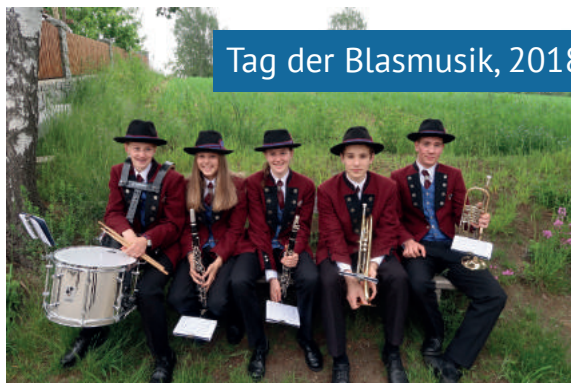
Tag der Blasmusik, 2018