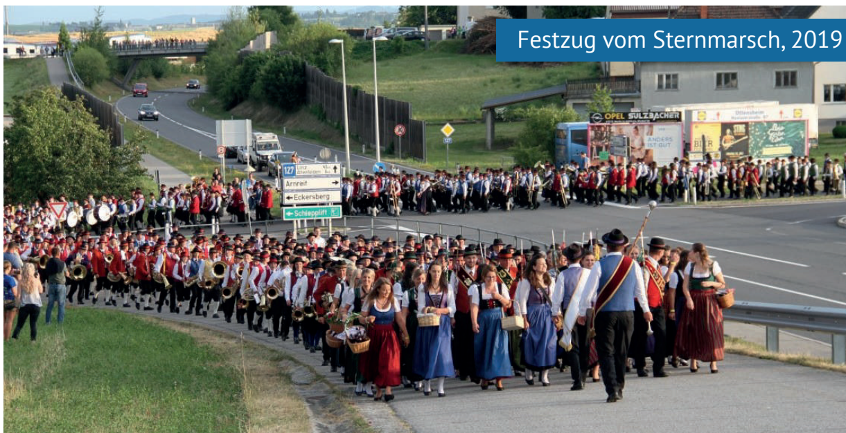
Festzug vom Sternmarsch, 2019