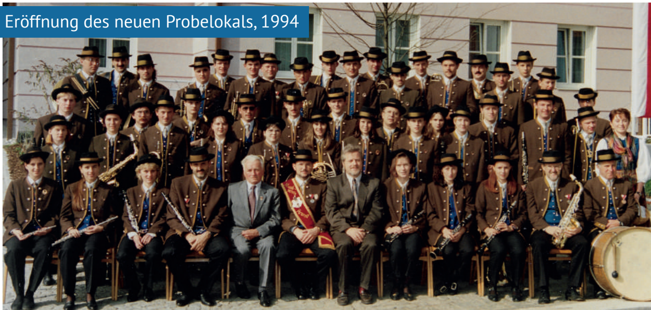
Eröffnung des neuen Probelokals, 1994