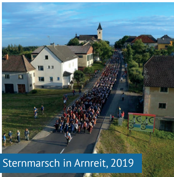
Sternmarsch in Arnreit, 2019

Als Kick-off für das Bezirksmusikfest 2020 in Arnreit veranstaltete der Musikverein im Juli einen Sternmarsch. 14 Musikkapellen aus dem Bezirk und eine Patchworkkapelle nahmen dabei teil. Das Highlight des Abends war der Festzug zum alten Sportplatz von Arnreit, bei dem über 500 Musikerinnen und Musiker gemeinsam in einem Block marschierten.